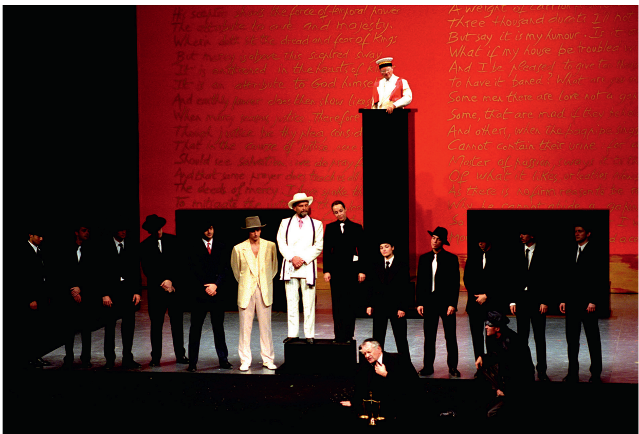
Le Marchand de Venise, mise en scène Andrei Serban, 2001