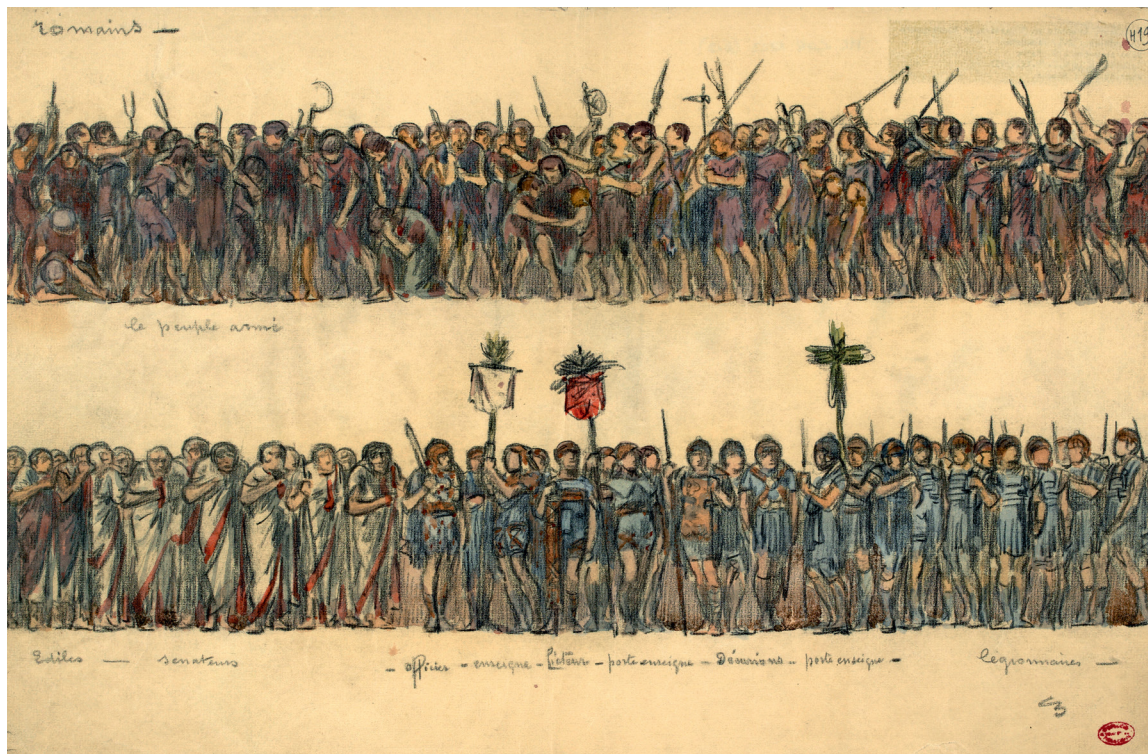
Les Romains dans Coriolan , dessin d'ensemble de Charles Bétout (costumier), mise en scène Émile Fabre, 1933