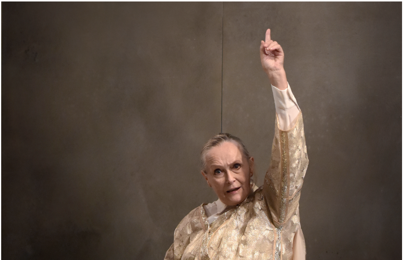
Jules César , de William Shakespeare, adaptation et mise en scène de Rodolphe Dana, Théâtre du Vieux-Colombier, 2019