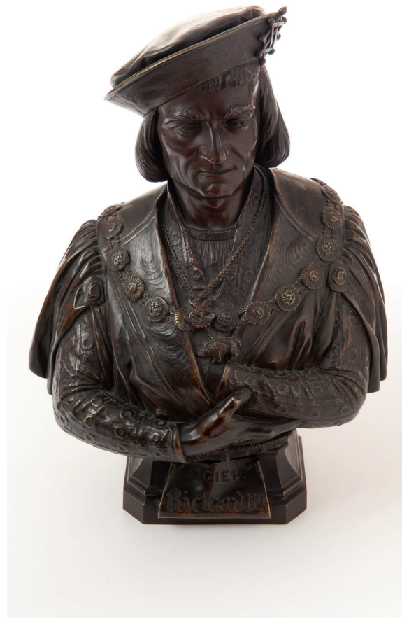
Buste en bronze par Dantan représentant Ligier dans Richard III , 1852 © P. Noack, coll. Comédie-Française

Le célèbre discours politique de Marc-Antoine devant la plèbe contre César rapproche Jules César de Timon d'Athènes par l'importance de la rhétorique et de Richard III (mise en scène par Terry Hands en 1972), par le renversement de la situation.