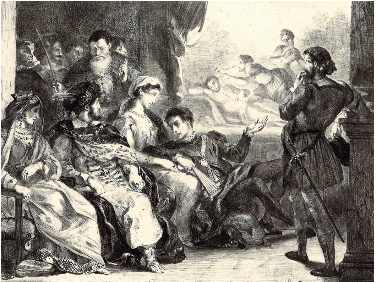
Hamlet , lithographie par Eugène Delacroix, 1864