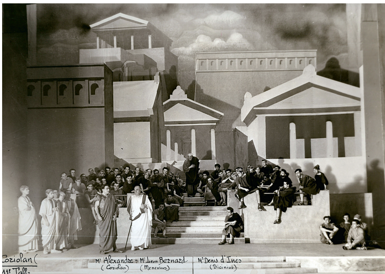
Coriolan , mise en scène Émile Fabre, 1933