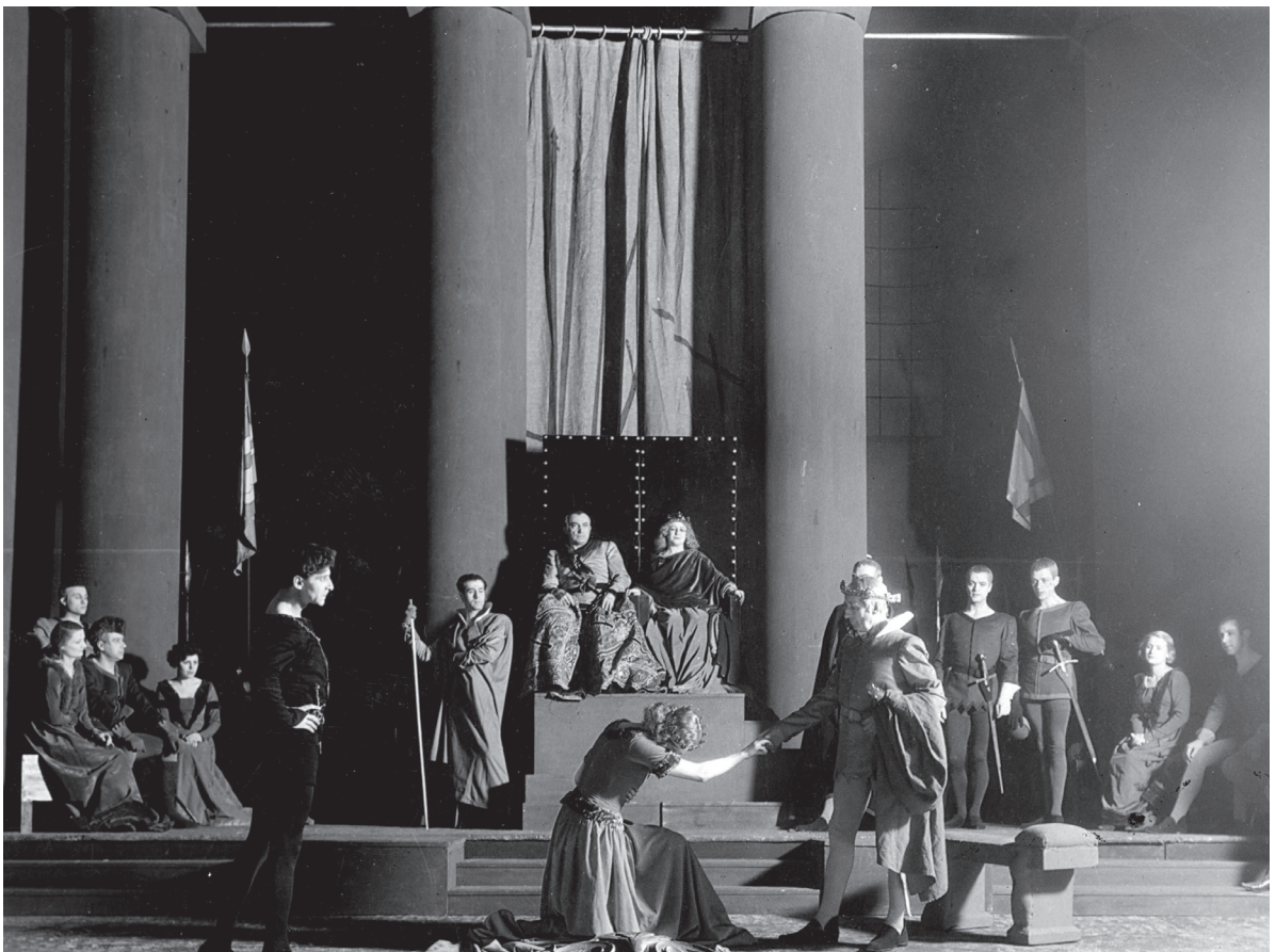
Jean Yonnel ( Hamlet ) dans La Tragique Histoire d'Hamlet, prince de Danemark , mise en scène Charles Granval, 1932