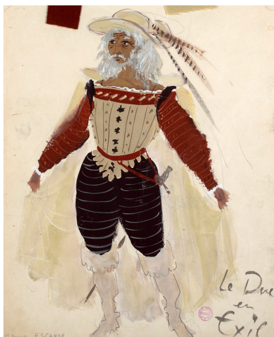
Comme il vous plaira : tiré de Shakespeare par Me Sand, et par les cheveux, estampe par Pochet, 1856