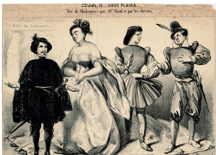
Maquette de costume de François Ganeau pour Comme il vous plaira , rôle du duc (Maurice Escande), mise en scène Jacques Charon, 1951